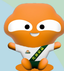
大咗鬼肩膀毛公仔