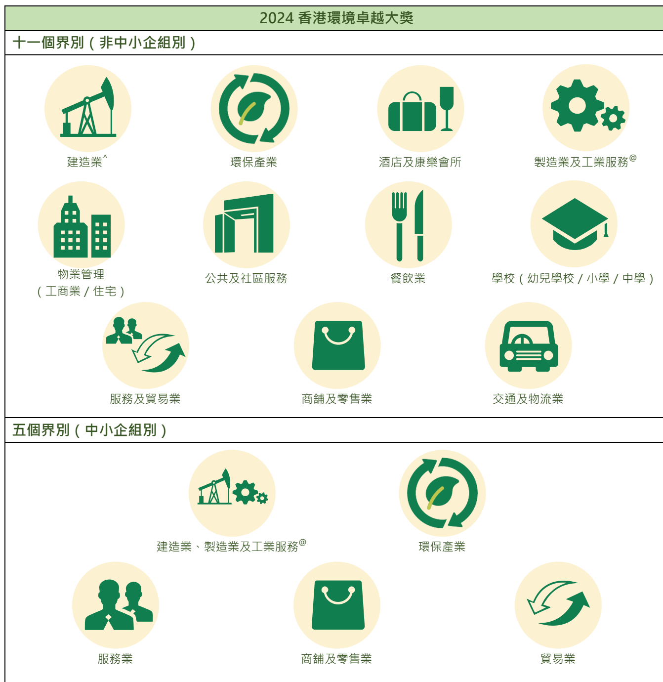
表一：「2024 香港環境卓越大獎」轄下的獎項類別

「香港環境卓越大獎」一直受到社會各界的認同，成為香港最具公信力的環保獎項之一。下表總結這個獎項的資料，而各個界別的詳情則於個別指南中詳述。